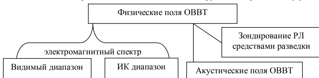
Рис. 1. Физические принципы обнаружения наземных объектов

Обнаружение объекта представляет собой процесс функционирования средства технической разведки, в результате которого фиксируются технические демаскирующие признаки объекта и делается заключение о его наличии, характеристиках и классификации. Поэтому физические поля (рис. 1) наземных ОВВТ непосредственно связаны с их демаскирующими признаками [9].